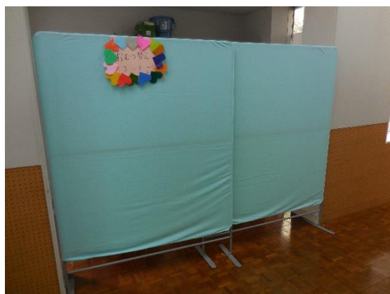
赤ちゃんスペース