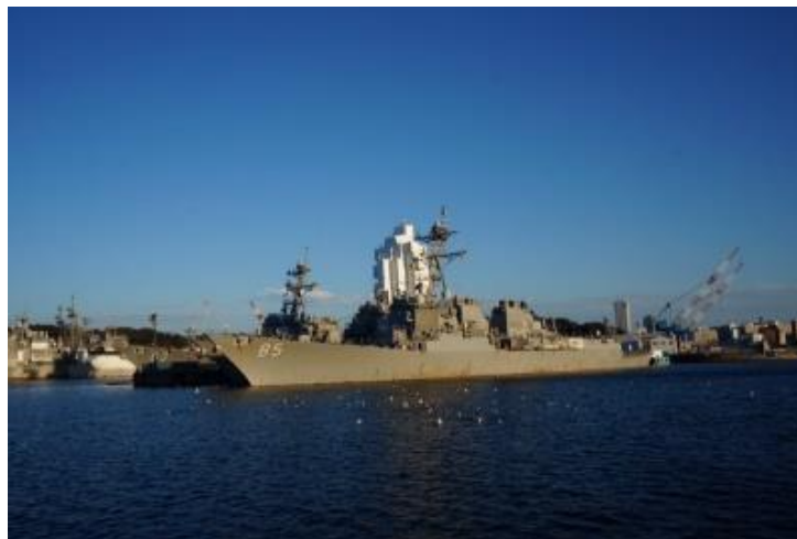
軍港巡りクルージング